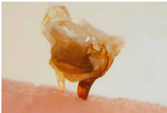
Abb.5: Nach einem Stich animieren Alarnduftstoffe aus dem Stachelapparat weitere Bienen zum Direktangriff.