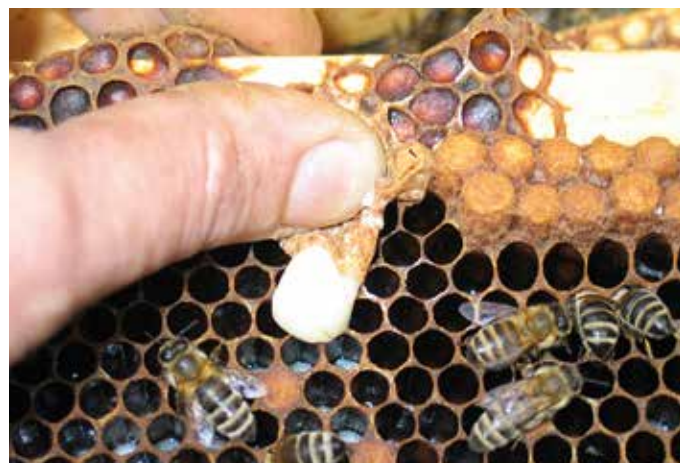
Abb.2: Schnell und schmerzlos: Weiselzellen und unerwünschte Königinnen werden am besten zerdrückt.