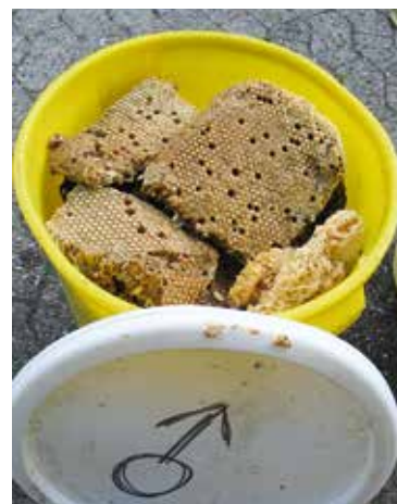
Abb.4: Kühles Ende: direkt nach dem Verdeckeln geschnitten, verenden die Drohnenlarven und -puppen in wenigen Stunden.