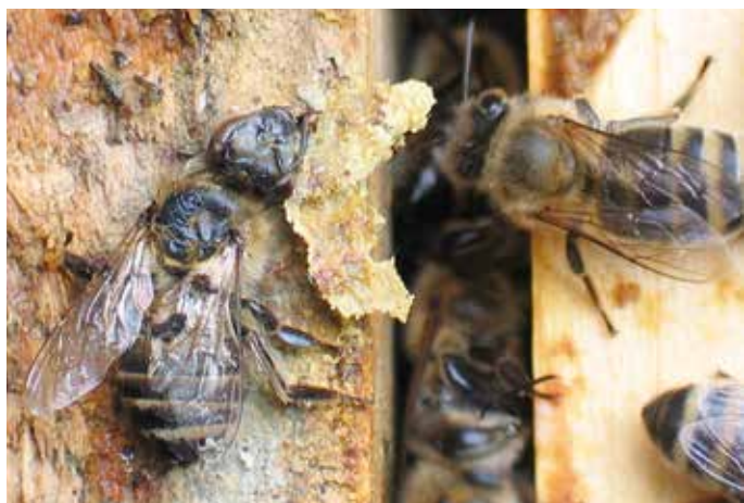
Abb.1: Rauch, lange Ohren, Zargen ohne Falz helfen gequetschte Bienen vermeiden.

Selbst Stockmütter, denen es nicht gelang auf ihrem Hochzeitsflug einen ausreichenden Spermiovorrat zu bunkern, haben in ihrem Staat einen schweren Stand. Und kaum ist die „hilflose Herrenwelt“ nach Ende der Schwarmzeit nutzlos geworden, wird auch sie von den Waben verdrängt und verhungert jämmerlich im Unterboden. Nur wenigen Drohnen ist das vermutlich weit angenehmere plötzliche Dahinscheiden im Zuge einer Begattung vergönnt.