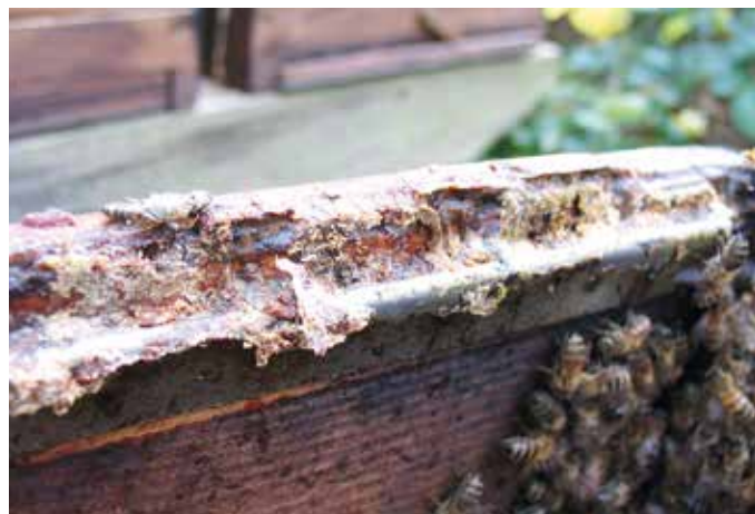
Abb.6: Metallauflageschienen vermeiden gequetschte Bienen nur solange der Imker bereit ist viel Zeit für ihre Reinigung zu investieren.

kältebedingte, vermutlich bewusste, Starre. Die schnelle Alternative direkt am Bienenstand: Kältespray. Vom Erdgrab und insbesondere einem Ertränken rate ich ab. Denn bedingt durch ihre wasserabstoßende Oberflächenbeschichtung dringt in das Atemsystem der Biene Wasser nur quälend langsam ein. Das Ersticken zieht sich hin.