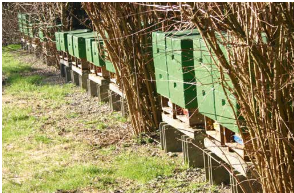
Erfolgt bis Ende Februar der erste Reinigungsflug, so bleiben größere Winterverluste über Darm-erkrankungen (Ruhr, Nosema) meist aus.

Blick in die Wabengassen. Nur keine Angst: Es ist noch kein Volk erfroren, aber schon viele, aus falscher Scheu vor Volkskontrollen bei Kälte, verhungert!