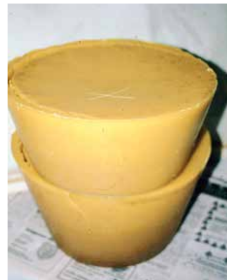
Blöcke zur Kerzenherstellung mehrfach aufreinigen