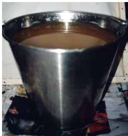
In konischen Edelstahlheimern klärt sich das Wachs besonders gut. Diese Eimer kann man zur feinsten Reinigung auch mehrere Stunden in die Backröhre (50°C) stellen und dort auskühlen lassen