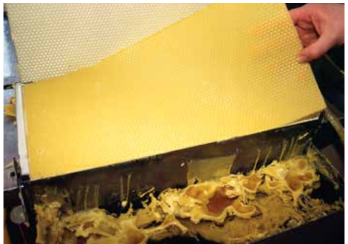
Eigene Mittelwände gießen macht Spaß und verhindert Rückstände durch Mittelwandzukauf