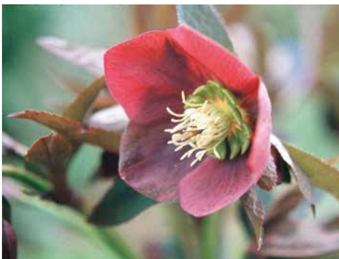
Die Christrose (Helleborus) blüht mitten im Winter