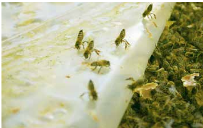
Weiselrichtig: Machen die Bienen beim Anheben der Folie einen Handstand Giftsterzeln), so sind sie weiselrichtig. Weisellose Völker machen das nicht und sitzen auch nicht in der kompakten Winterkugel sondern weit verstreut

die vorbereiteten, gedrahteten Rähmchen ein. Das hat den Vorteil, dass die Mittelwände noch etwas gedehnt sind und keine Wellen werfen, bei der späteren Verwendung im Bienenvolk. Während dem Einlöten kühlt zwischenzeitlich die nächste Mittelwand in der Form. Gießen und Löten lassen die Stundenleistung an Mittelwänden sinken, es hat aber den Vorteil den Prozess der Wabenerneuerung in einem Zug abgeschlossen zu haben. Belohnt wird man dann später durch schön ausgebaute, goldgelbe und rückstandsfreie Waben aus reinem Bienenwachs. Mit Honig gefüllt eine appetitliche Augenweide im Honigraum!