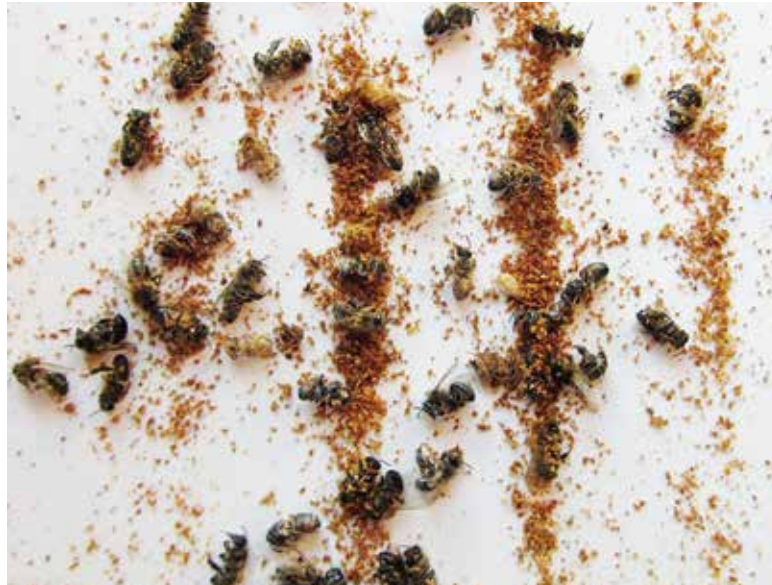
Gemülle eines kleinen varroabelasteten Volkes: Erkennt man jetzt schon an den Bodeneinlagen, das das Volk sehr viele Varroen hat, so merkt man sich den Kandidaten für eine totale Brutentnahme im März vor.

Die Mittelwände gieße ich in einer wassergekühlten Silikonkautschuk Form. Sie hat den Vorteil, dass die Mittelwände trocken, ohne Lösemittel und in der richtigen Größe (ohne Zuschneiden) hergestellt werden können. Wichtig für eine gute Stundenleistung (60 und mehr Mittelwände) ist das Bereiten von einer größeren Menge geschmolzenen Wachses (sechs Kilo und