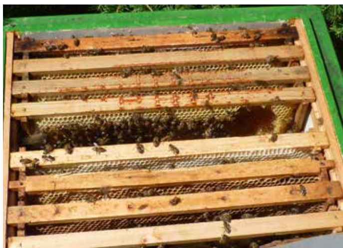
Futtermangel, Futtertasche muss in Kontakt zum Bienensitz und nicht an den Rand!

Wer die Absicht hegt einen Standortwechsel oder einen Platztausch um wenige Meter, mit seinen Bienen vorzunehmen, der hat jetzt eine günstige Gelegenheit dazu: In der Winterruhe vergessen die Flugbienen die „Koordinaten des Standortes“, stellt man in der Winterruhezeit die Beuten innerhalb ihres Flugkreises um, so kommt es nicht zu Rückflügen zum alten Platz. Diese Umstellaktionen müssen erschütterungsfrei und nicht bei