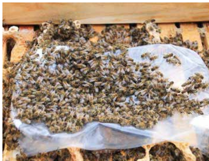
Notfütterung mit aufgelegter Gefrierüte