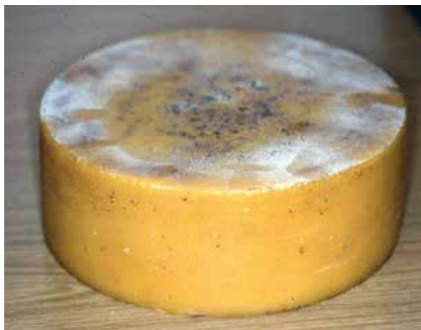
Wachsblock an der Unterseite mit Stockmeißel abschaben. Dieser Block hier ist nicht sauber genug, er muss noch einmal umgeschmolzen werden

Neue Rähmchen selbst herzustellen lohnt meist nicht mehr, bei dem guten und günstigen Angebot der Fachhändler. Selber drahten mit Edelstahl macht dennoch Sinn, oft sind die vorgedrahteten Rähmchen zu schlaff gespannt, die Nägel der Drahtenden komplett eingeschlagen, so dass ein Nachspannen nur erschwert möglich ist. Edelstahl zum Drahten, hat den Vorteil, dass er meist eine genauso lange Lebensdauer hat, wie das Rähmchen selber.