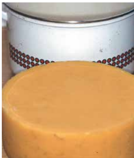
Kleinmengen Wachs lassen sich mit etwas Wasser gut in Emailletöpfen reinigen. Topf auf der Herdplatte erkalten lassen