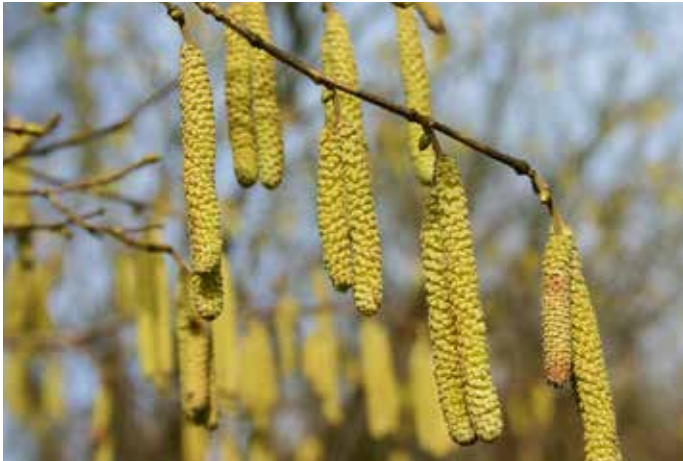
Gegen Ende des Monats erblühen die ersten Haselsträucher. Im Zuge des Klimawandels merkbar früher als sonst.