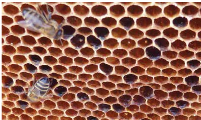
Abb.1: Nach Infektion mit dem Erregertyp ERIC I sind erkrankte Völker oft an klassischen Symptomen (Larven als fadenziehende Masse oder eingetrocknete festsitzende Schorfe) schon durch optische Beschau erkennbar. Für den Erregertyp ERIC II ist solche Klinik eher untypisch, am Volk erkennt man die Erkrankung oft nicht.

Wie auf Abb.1 sieht man leider oft erst, wenn das an AFB erkrankte Bienenvolk schon mit einem Bein im Grab steht. Seit dem Einschleppen der krankheitserregenden Sporen, also der Infektion, können Monate, beim Typ ERIC II vermutlich sogar Jahre ins Land gegangen sein. Und, wenn neben Unglück auch noch Pech dazu kommt, umliegende Bienenvölker und -stände sich ebenfalls infiziert haben.